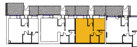
Schematyczny rzut piętra