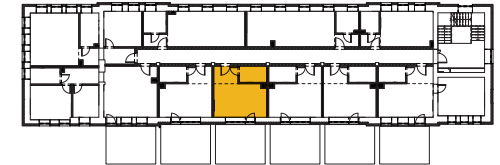
Schematyczny rzut piętra