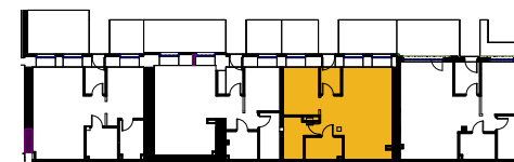
Schematyczny rzut piętra